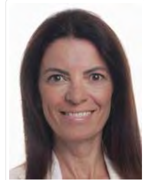
Beato Castellano Socorro