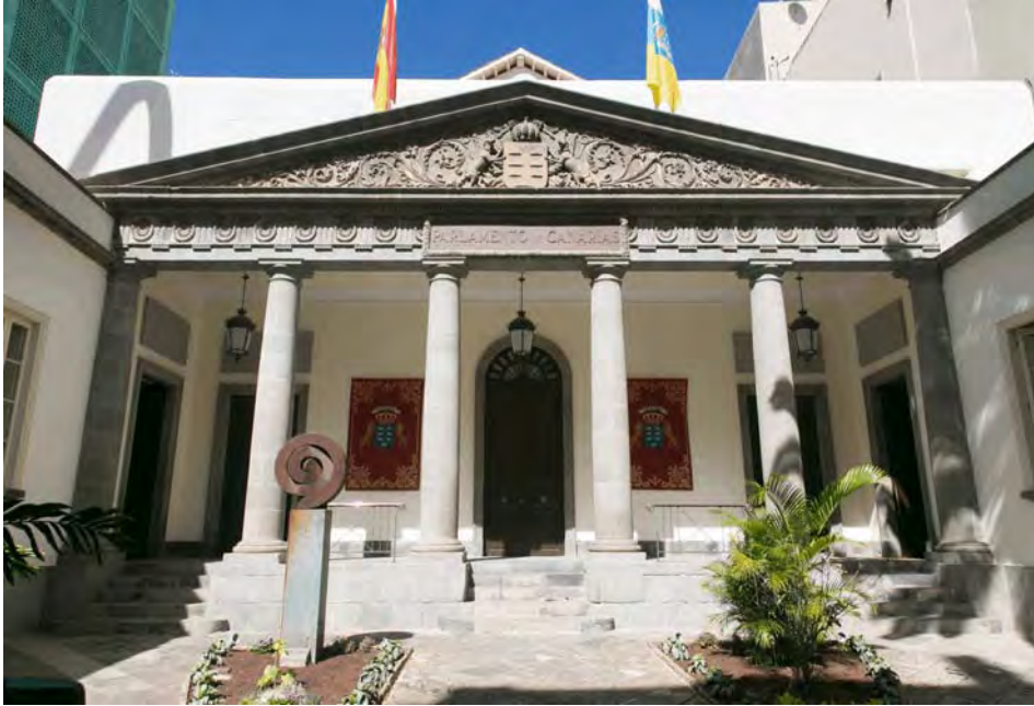
La Sede del Parlamento

C/ Teobaldo Power, 7 38002 - SANTA CRUZ DE TENERIFE Tfno. 922 473 300 - FAX 922 473 400